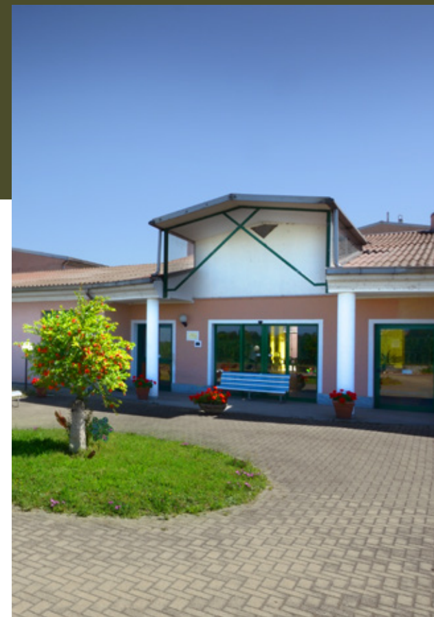
Residenza Il Melograno