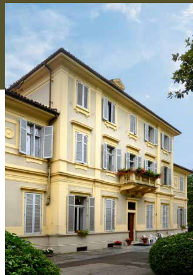
Residenza Villa Cora